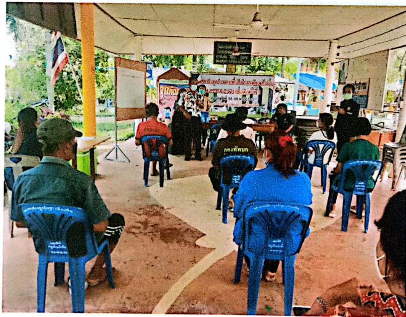
ภาพการประชุมประชาคมการส่งเสริมการมีส่วนร่วมของประชาชนในการจัดทำแผนพัฒนาท้องถิ่น (พ.ศ.๒๕๖๖-๒๕๗๐) เพิ่มเติมครั้งที่ ๑ ณ ศาลาประชาคม หมู่ที่ ๑ บ้านท่าโรง ตำบลศรีมหาโพธิ์ อำเภอศรีมหาโพธิ์ จังหวัดปราจีนบุรี