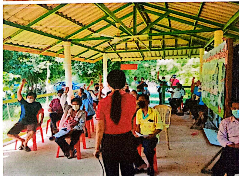
ภาพกิจกรรมการจัดเวทีประชาคมระดับหมู่บ้าน ประจำปีงบประมาณ พ.ศ.๒๕๖๖ ขององค์การบริหารส่วนตำบลศรีมหาโพธิ ในด้านการส่งเสริมการมีส่วนร่วมของประชาชน เพื่อรับฟังปัญหา ตลอดจนความต้องการของประชาชนในหมู่บ้าน/ชุมชน