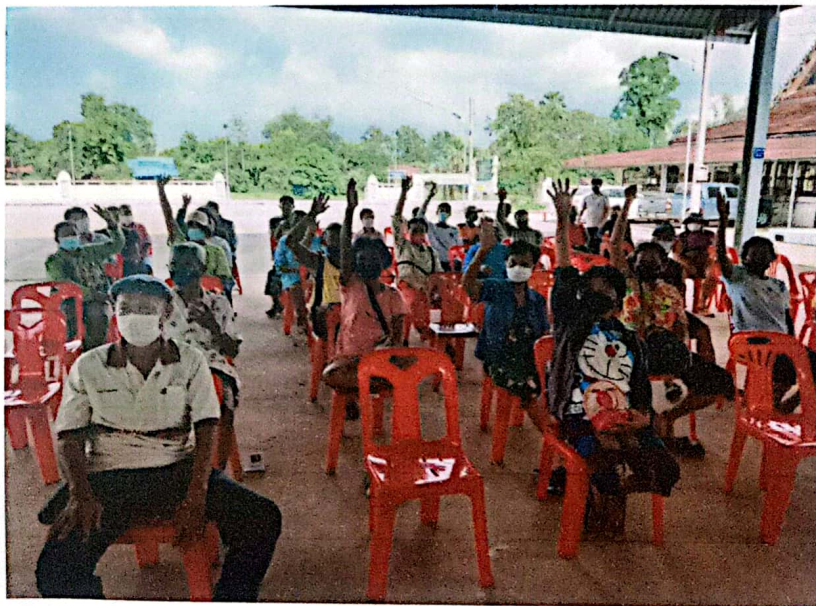
ภาพกิจกรรมการจัดเวทีประชาคมระดับหมู่บ้าน ประจำปีงบประมาณ พ.ศ.๒๕๖๖ ขององค์การบริหารส่วนตำบลศรีมหาโพธิ ในด้านการส่งเสริมการมีส่วนร่วมของประชาชน เพื่อรับฟังปัญหา ตลอดจนความต้องการของประชาชนในหมู่บ้าน/ชุมชน